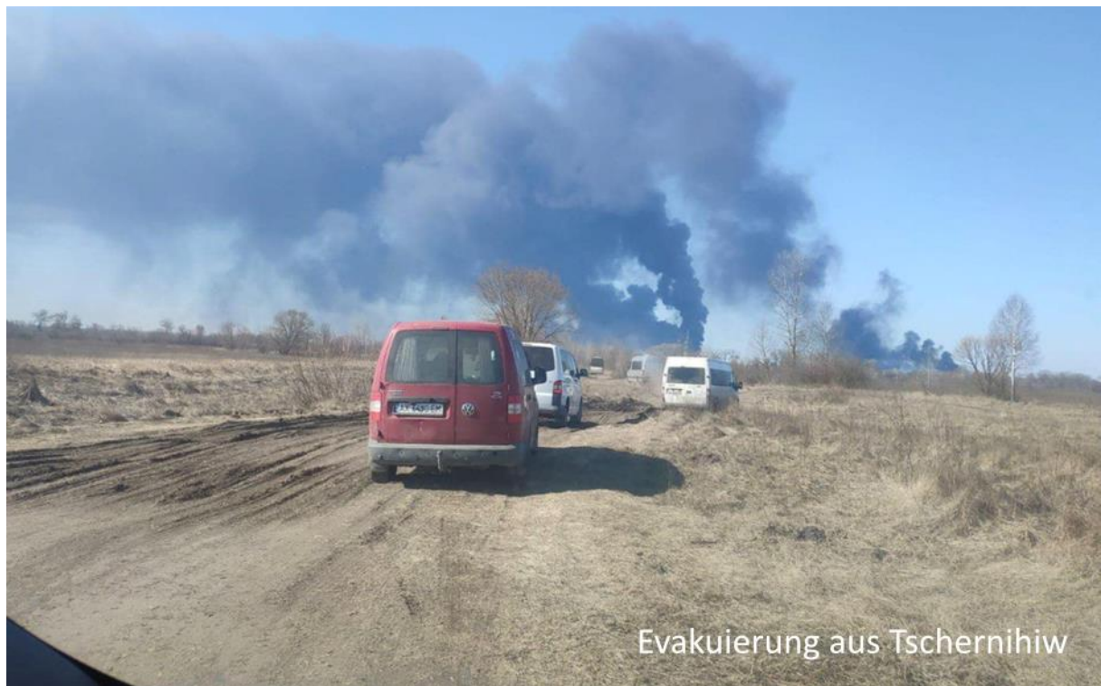
Evakuierung aus Tschernihiw

Klopft an, so wird euch aufgetan. (Matthäus 7,7) Ein Vers der uns zu allen Zeiten ermutigt, im Leid bei Gott anzuklopfen. Nirgendwo anders, sondern bei dem für den nichts unmöglich ist und der uns helfen und retten will. Er macht die Tür gern auf, die bleibt bei ihm nicht zu!